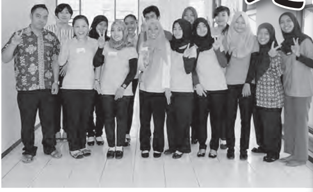
生徒たち (現地: ジャカルタ)