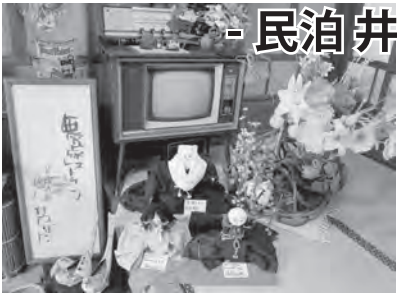
帯で作った人形が「お出迎え」