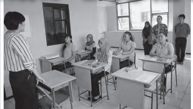
授業の様子 (現地: ジャカルタ)