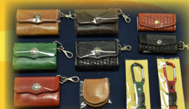
革製のキーケースやミニ財布