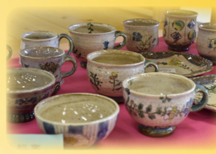
香肌窯のカップやお茶碗