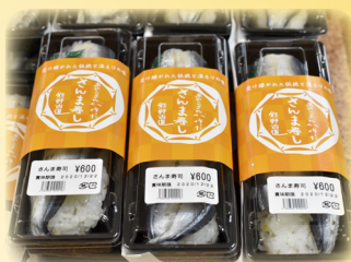
サンマ寿司・めはり寿司