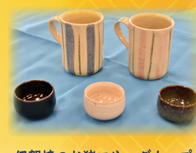
伊賀焼のお猪口やマグカップ