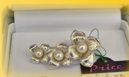
本真珠のブローチ