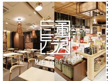
三重テラス ホームページ