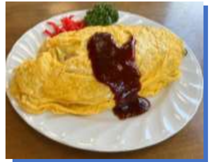
おすすめの「おむちゃ」

【住 所】三重県桑名市長島町西外面 1553 【営業時間】11:00～14:00 (L.O. 13:30) 17:00～21:00 (L.O. 20:30) 【定休日】毎週水曜日・第3火曜日 【電話番号】0594-42-0269 【駐車場】8台